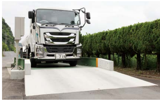
トラックスケール

汚泥の搬入車両を投入前と投入後に重量測定できるように、トラックスケールを2基設置しました。