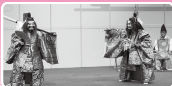
奥出雲神代神楽社中