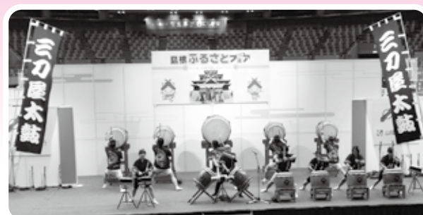
三刀屋太鼓振興会