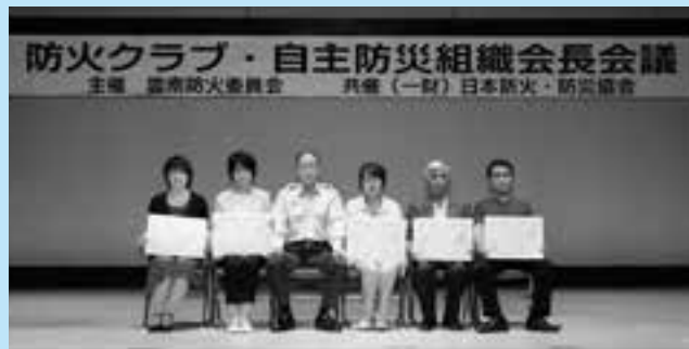
受賞された防火クラブの皆さん