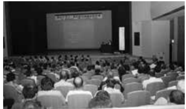
雲南市立病院DMAT 講演の様子

また、日頃の積極的な活動が認められ、7防火クラブが雲南防火委員会会長表彰を受賞されました。