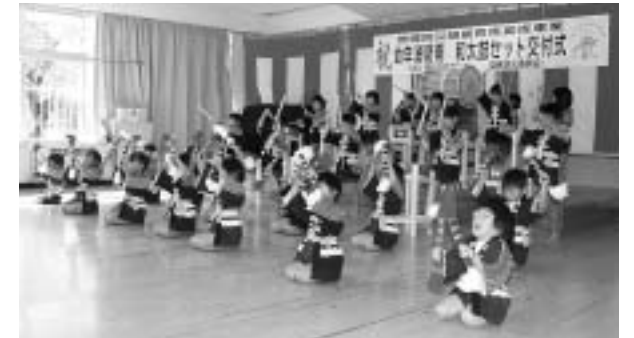
園児よる和太鼓演奏及び銭太鼓