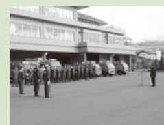
防火パレード出発式