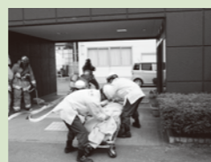
飯南町 特別養護老人ホーム愛寿園での火災想定訓練