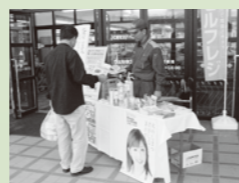
住民の皆様には住宅用火災警報器の早期設置を呼びかけました。