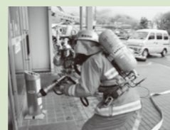
奥出雲町 横田ショッピングセンター蔵市での火災想定訓練