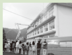
鍋山小学校火災想定訓練の様子を見学する鍋山幼稚園の園児さん。