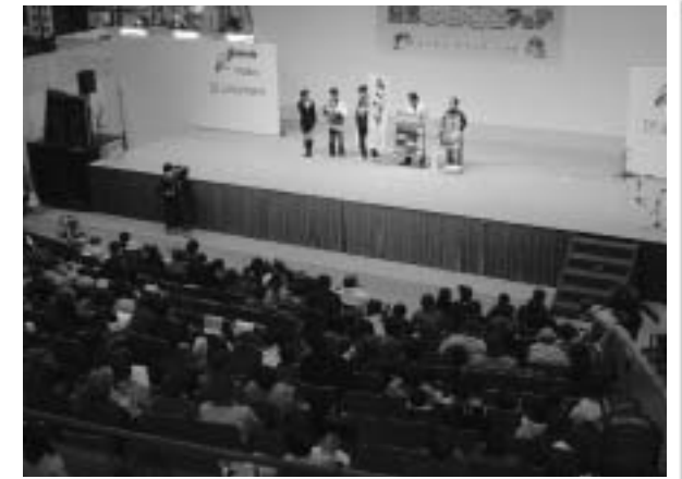
ステージではお国自慢PRタイムなどもあります