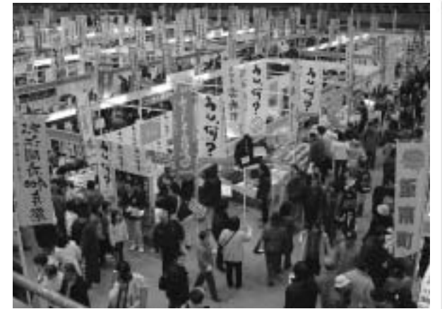
2日間で17万人以上の来場者があります

雲南広域連合では、雲南地域の参加者の中心となり魅力ある雲南地域の情報を発信してまいります。