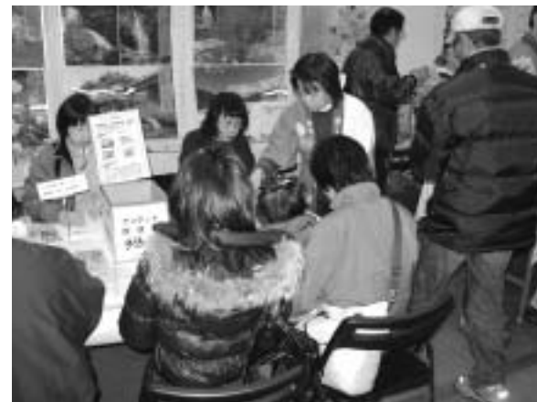
在広島ふるさと応援団にもお手伝いいただいています