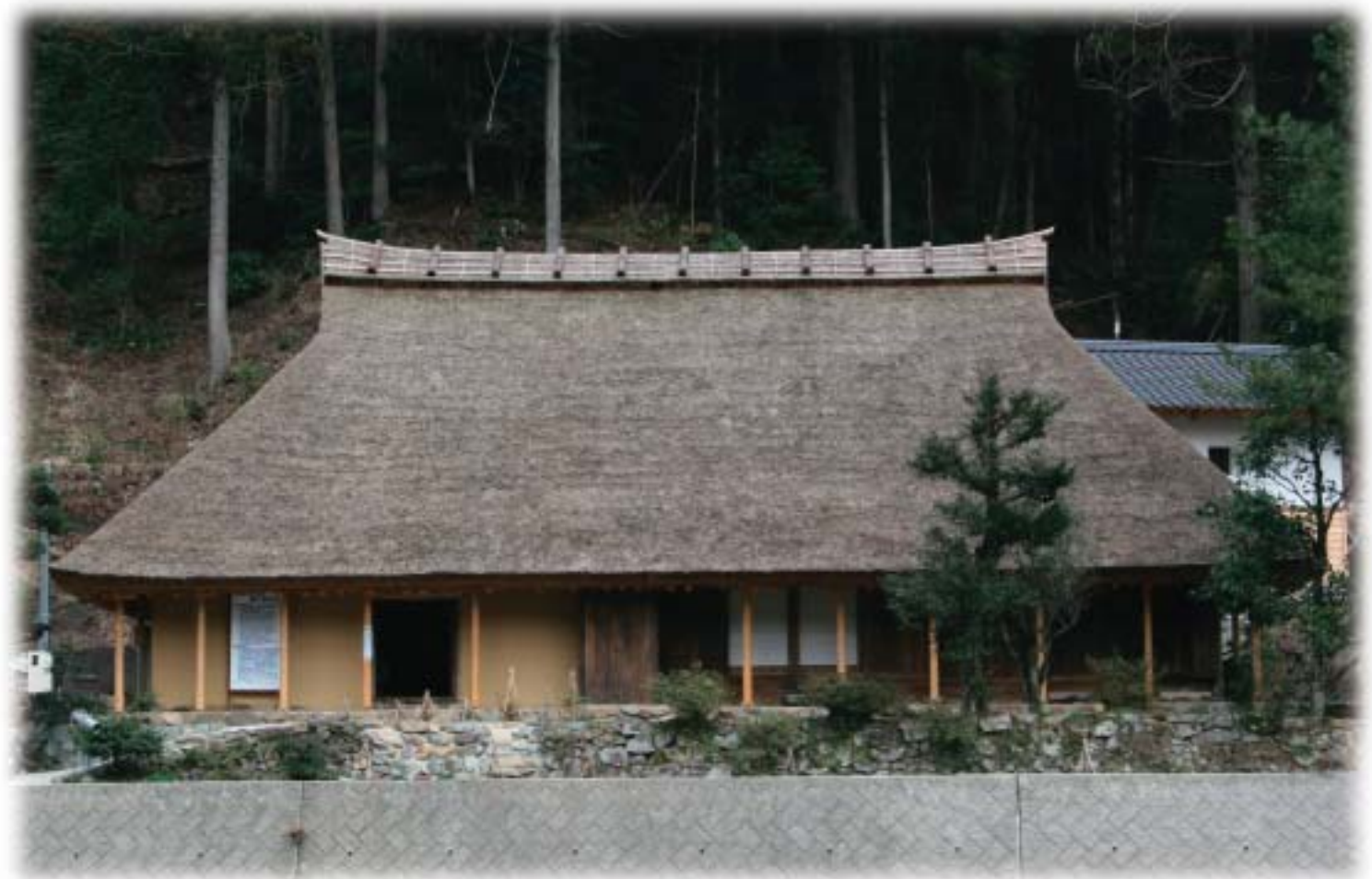
堀江家住宅 雲南市吉田町民谷地区

広報うんなんは、雲南広域連合・公立雲南総合病院・雲南消防本部が共同で発行しています