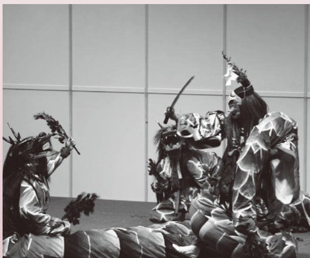
ステージでは、郷土芸能が披露されます。