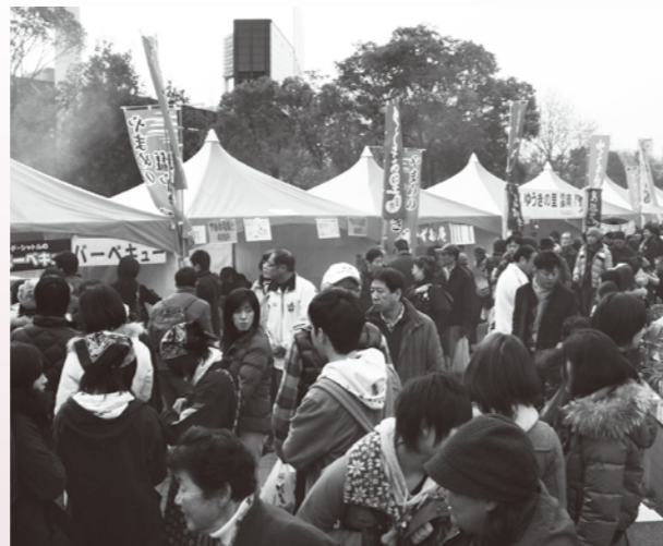
島根のおいしいものが食べられる屋外会場の「島根あつあつ屋台村」は歩けないぐらい混雑していました。