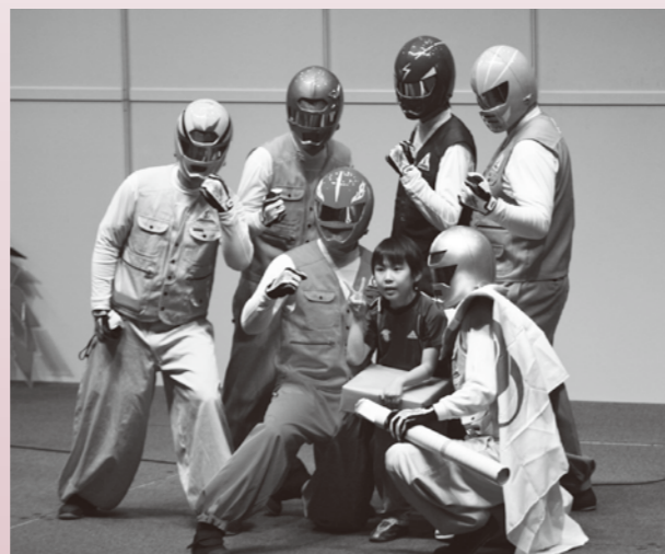
雲南地域のご当地キャラも応援に駆け付けてくれました。