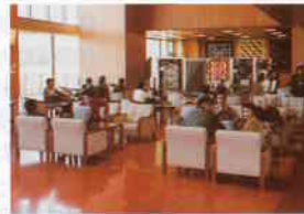
玉峰山荘内ロビーで休憩

2 亀嵩温泉「玉峰山荘」で露天風呂・うたせ湯・すわり湯などにゆっくり浸かり、その後は雲南田舎料理の昼食を堪能しました。