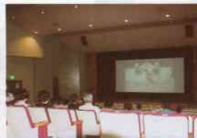
同館内神楽ホール