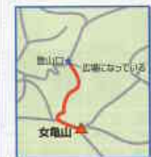
登山口：女亀山登山口