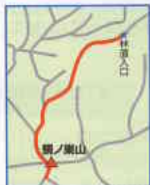
登山口：トイレ付駐車場付近