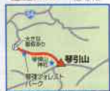
登山口：琴引ワオレストパークスキー場