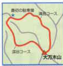
登山口：最初の駐車場