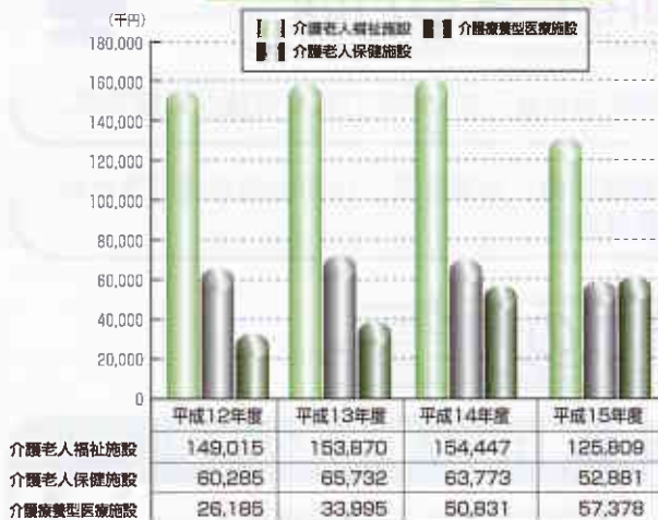
年次別費用額（月平均） （施設サービス）

施設費用額の状況を見ると、十五年度に施設の介護報酬が引き下げられたことあって、前年度を下回っています。三施設の状況は、介護福祉施設が五十三%と約半分を占めており、あとの半分を介護老人保健施設及び介護療養型医療施設がほぼ半分づつ占めています。 ただ、十四年度までは、介護老人保健施設の費用額が介護療養型医療施設の費用額を上回っていました。十五年度は新たな施設ができた影響もあり、逆転しています。