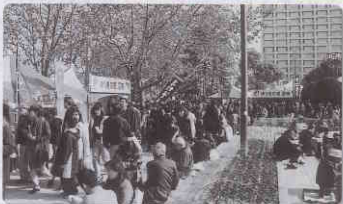
屋外「しまねあつあつ屋台村」のにぎわい

雲南ブロックからは屋内ブースに10ブース(各町村1ブース)、屋外ブースに14ブース出展し、総売上額は1,135万円あまりとなりました。