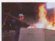
■雲南で生きる人と技