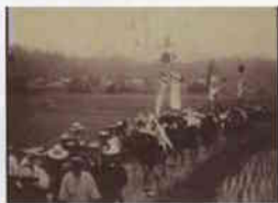
■赤来町 昭和初期の赤来町