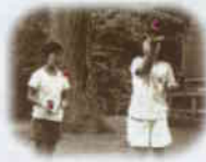
■昭和のあそび図鑑