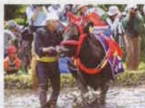
■仁多町 仁多米について

平成15年度も引き続き内容を充実していきます。本年度は、未来・夢・将来ゾーンには「大東町」「三刀屋町」「掛合町」「吉田村」「頓原町」の5町が新たに加わる予定です。その他にも様々なコンテンツを順次公開していきます。