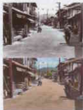
■タイムトラベラーUNNAN