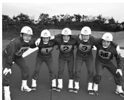
奥出雲町消防団布勢分団