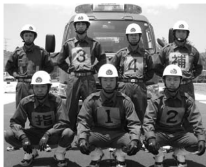
奥出雲町消防団三沢分団