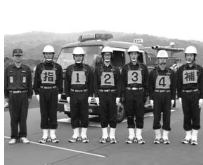
雲南市消防団大東方面隊