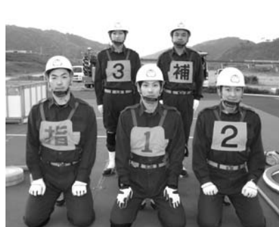
雲南市消防団木次方面隊