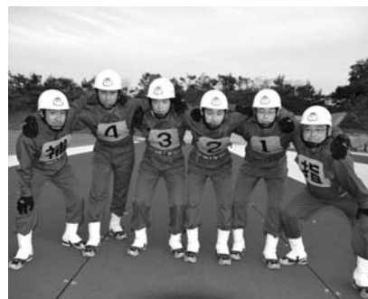
奥出雲町消防団八川分団