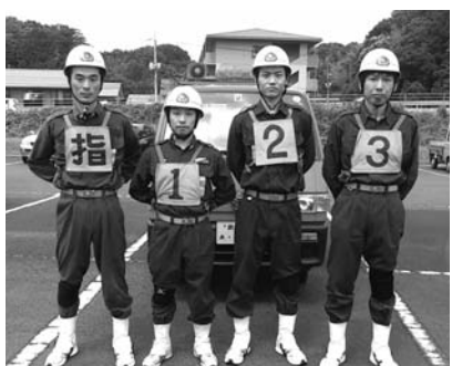
雲南市消防団加茂方面隊