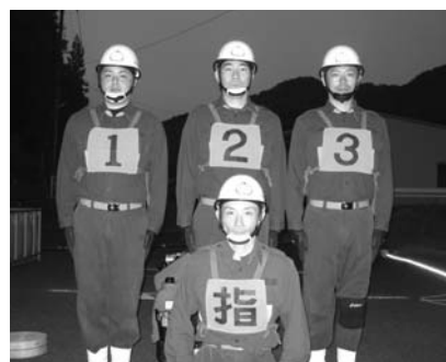
雲南市消防団掛合方面隊