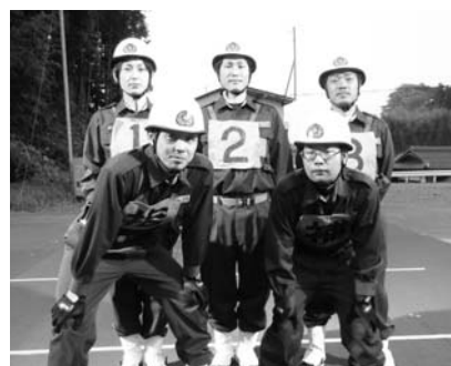
飯南町消防団第6分団