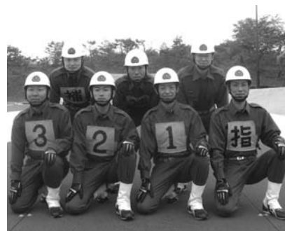
奥出雲町消防団横田分団